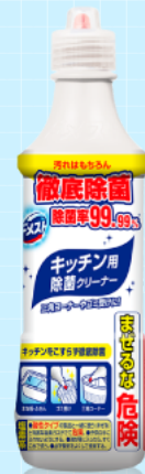
ドメスト ホワイト&クリーン